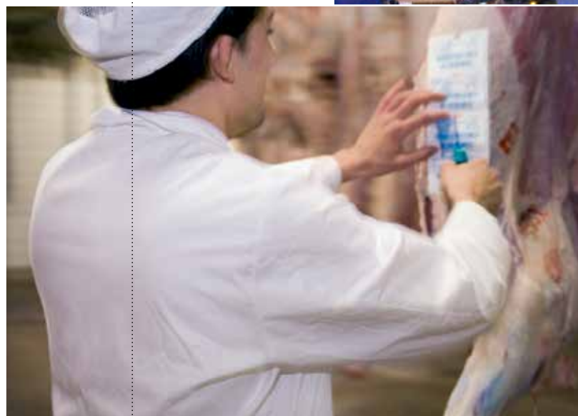
Un equip de l'Agència de Salut Pública vetlla per la seguretat alimentària dins del recinte