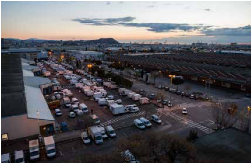
Mercabarna concentra els mercats majoristes de producte fresc, l'Escorxador de la ciutat i una Zona d'Activitats Complementàries

Dins del recinte hi ha el Mercat Central de Fruites i Hortalisses, el Mercat Central del Peix i l'Escorxador de Barcelona. També hi ha la Zona d'Activitats Complementàries (ZAC), un espai on s'ubiquen empreses que aporten valor afegit al producte i donen servei al client, així com firmes de serveis especialitzats (empreses logístiques, de fred industrial, tallers, etc.) i d'atenció a l'usuari (restaurants, hotel, llar d'infants, farmàcia, etc.). Molt a prop de Mercabarna, a Sant Boi de Llobregat, hi ha el recinte on està ubicat Mercabarna-flor.